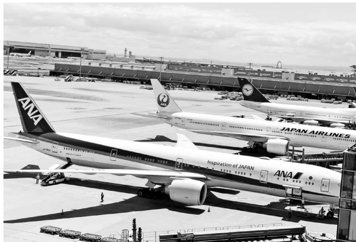
2025年の発着回数が49万回に達した羽田空港