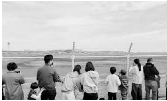
中部国際空港の滑走路西側からフェンス越しに見学する参加者

航空安全会議名古屋支部では、安全に対する啓発活動の一環として、毎年「安全集会」を開催しています。昨年初めて実施した「中部国際空港滑