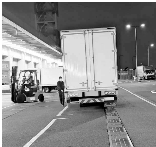
トラックから貨物を降ろすJGS社員

を維持するためには、最終的にパイロット自身の判断力が極めて重要であることが改めて確認されました。 また、「ポジティブ・セーフティ・カルチャー」については、ICAO（国際民間機関）やIAA（国際航空運送協会）など航空業界全体と連携しながら、懲罰を前提とするのではなく、「報告しやすい安全文化」を構築していく重要性が共有されました。パイロット、航空会社、規制当局が相互に協力し、安全性向上に取り組む必要性が強調されました。 最終日には、これら2つのテーマに関する総会声明（conference statement）が採択されました。 さらに、昨年開催されたICAO第42回総会（ICAO Assembly