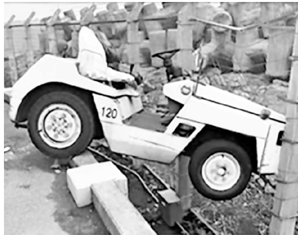
運転操作を誤りフェンスに突っ込んだ車両

2025年12月の航空法施行規則等の一部改正により、空港における滑走路の安全対策の強化策が打ち出されました。その二つが、グランドハンドリング事業者に対する安全監督体制の強化です。事故等の防止措置の実施や、国による調査に協力させるとともに、事故等防止に向けた協議会の設置（主要8空港に設置）が求められています。こうした管理体制強化の背景には、制限区域内で発生する事故の約8割をグランドハンドリング関連が占めている実態があります。グランドハンドリングの安全をめぐる現状について報告します。