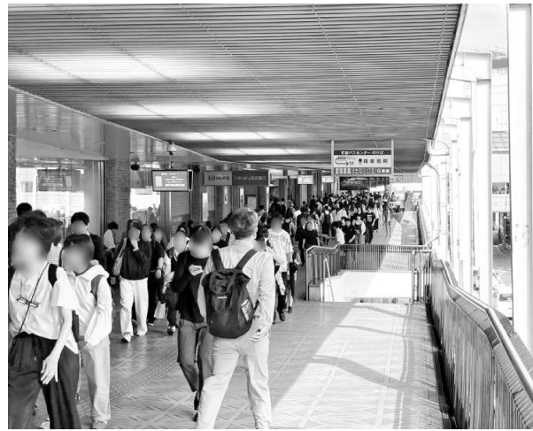
多くの労働者に影響を及ぼす労基法改正