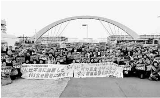
3月9日、羽田空港でのアピール行動に参加したみなさん