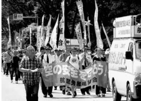
第89回中央メーデーでの航空連のデモ行進

いるわけではありませぬ。いつでも回避指令を出せる体制を整え、安全を確保するために必要なことなのです。成田空港では安全で効率的な運航のために、交通特性に応じて運用方法を委ねています。そのため、1日の中でも管制官の業務は変化します。運