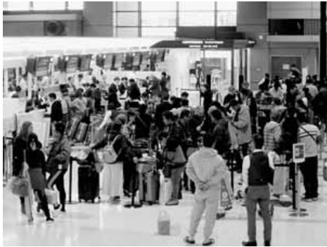
訪日外国人で混雑する成田空港。3月20日