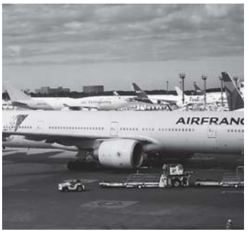
沢山の労働者が働く成田空港(写真と本文は関係ありません)

法9条に自衛隊の存在を明記することであるが議員総会では、我が党は結党以来、憲法改正を覚悟として掲げ、長い間議論を重ねてきた「私たちが政治家であり、それを現実にしているべき責任がある。いよいよ実現する時を迎えている。責任を果たして」と。(1月23日付「朝日新聞」)と呼びかけました。弁護士で東京都知事にも立候補した宇都宮健児氏は、安倍政権がめざす憲法改正の本丸は、憲