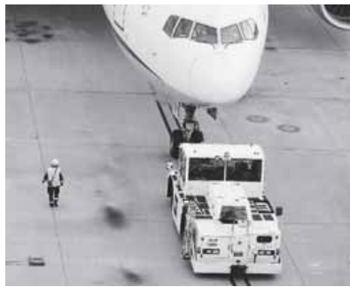
スポットから航空機を押し出すプッシュバック作業

空港で航空機の到着から出発までの地上作業を行うグラウンドハンドリング(クラハン)。コスト削減を追求する航空会社