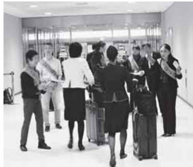
JALオペレーションセンター前での宣伝行動

17年末交渉では、JFU・CCUの2労働組合は「統一要求(争議解決を求める4項目)に基づき、解雇者の復職など具体的な要求を提示し会社を求めました。会社は具体的な要求が示されたことについて「新たな提案を提示された」と認識した。「提案を預かる」としました。CCUとの交渉でも会社は、「統一要求を」持ち帰るとの発言をしました。1月12日の社長出席の経営協議