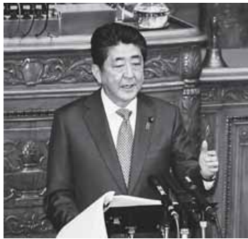
施政方針演説する安倍首相