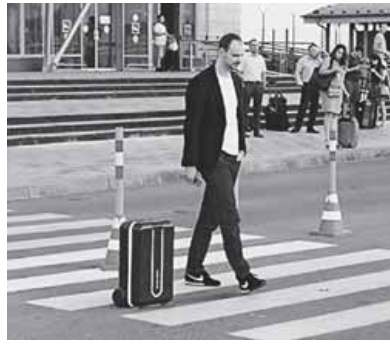
人に付いて動くスーツケース