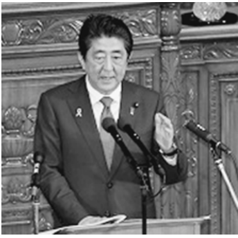
所信表明演説する安倍首相