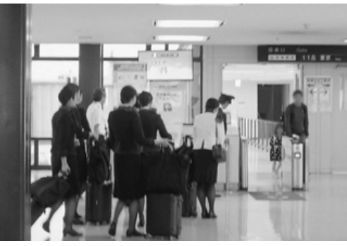
旅客の降機を待つ出発便クルー