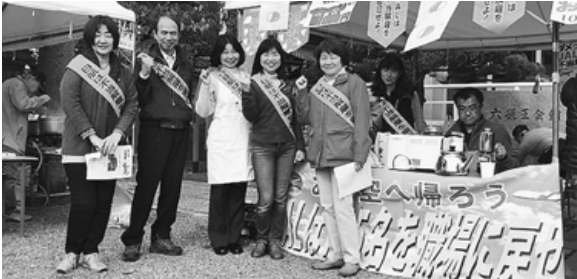
交流まつりでカレー店を出した原告のみなさん

一院内集会開催のご案内 日航に統一要求に基づく早期解決求める院内集会 1. 日時 12月6日 12:00~15:00 2. 場所 参議院会館 101号会議室(1階) 3. その他 参加希望者は直接参議院会館にお越しください。 ロビーにて担当者が入館証をお渡しします。 主催 JAL不当解雇撤回国民共闘 日本航空乗員組合 日航キャビンクルーユニオン JAL不当解雇撤回協議団