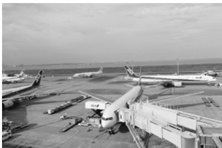
出発便で混雑する羽田空港

※1 夏・冬各2カ月+期末一時金(最大2カ月)+α。 ※2 第3四半期決算後に期末賞与について協議 ※3 JGS札幌、JGS大阪、JGS九州も同回答 ※4 夏・冬各2.1カ月+期末一時金(最大1.6カ月)+α