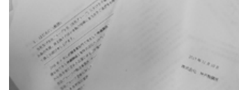
公表された神戸製鋼所の事故報告書

「野党の質問時間を一方的に削った」ことでは信頼されません。野党は政府法案提出の段階で内部で十分吟味・審議できるのに対し、野党は参加も情報共有できない。そう考えると配分比率は1対9といふくらいだ。政権側が審議できる機会は無意味にある。批判的吟味も適切なチェックにまで国会論議の意義があり、そこに時間が割かれるべきだ。野党の質問時間の絶対量を増やすべきではないかと長崎県知事 大学法学部教授は指摘しています。